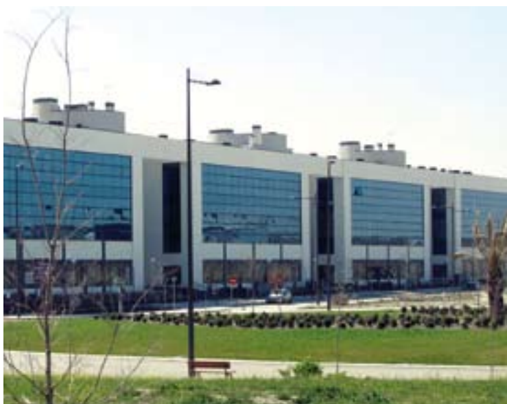
■ El Concejal de Urbanismo destacó que en Getafe estará concentrado el 75% de la aviación española.

El Parque Empresarial La Carpetania es una de las áreas de desarrollo industrial y tecnológico más importante de Europa y su I Fase fue un ejemplo de impulso económico desde la administración. Este desarrollo industrial se encuentra situado en un enclave estratégico, entre la Autovía Nacional IV, la M-50 y el Parque Tecnológico TecnoGetafe. El Parque está destinado a empresas relacionadas con el sector de la tecnología, la innovación, la investigación y los nuevos modelos productivos. El desarrollo de la I fase, con 1,5 millones de metros cuadrados desatacó por la rapidez en la instalación de empresas de calidad e investigación como Knörr Bremse, Siemens, General Electric o el Grupo de Ingeniería HDM.