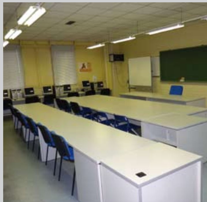
■ Sala REDINT Getafe del Centro de Empresas.

recibir correo, disponer de servicios de teléfono, fax, mantener reuniones con clientes y proveedores. El coste de este servicio es de 21,30 € al mes y en la actualidad hay cuatro empresas que lo utilizan.