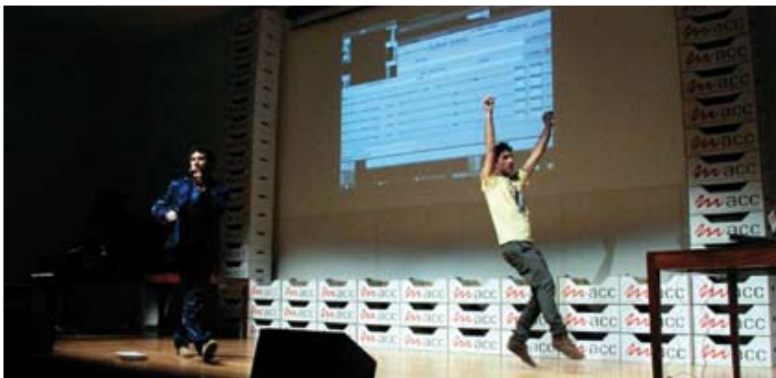
■ La asamblea estuvo enmarcada en las jornadas MACC2010.

edición del Mercado Atlántico de Creación Contemporánea (MACC 2010), tuvo como principales conclusiones que las actuaciones para los dos próximos años deben basarse en la creatividad y la innovación.