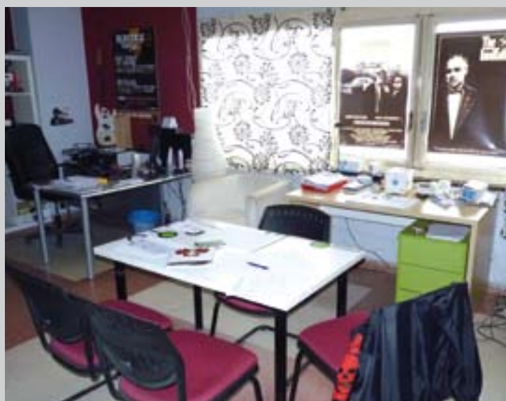
■ Local de una de las empresas instaladas en el Centro

Horario: El horario es de lunes a viernes, de 8 a 21:30 h. y sábados de 9 a 14 h.