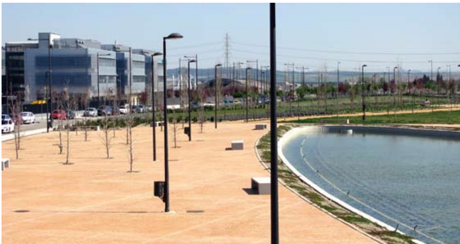
■ Las zonas verdes son uno de los valores añadidos de La Carpetania.

y Cultura, se mostró satisfecho al hablar de un "proyecto consolidado en el que ahora hay que cumplir los compromisos con los propietarios y cerrar la inversión con las entidades bancarias".