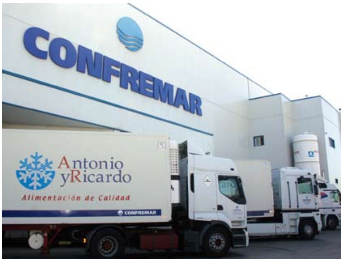
■ Confremar ahora cuenta con unos equipamientos de última generación que aseguran la máxima calidad de sus productos.

nómico que vivimos, ésta es una muestra más de cómo se genera empleo de calidad", añadió.