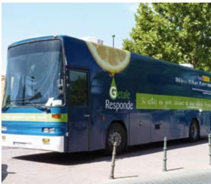
■ El autobús contaba con personal cualificado para atender a la ciudadanía.

que se están tomando para combatir el desempleo en la ciudad así como poder informar acerca de las posibilidades que existen de encontrar un empleo mediante la Agencia de Desarrollo Local, GISA, y la Agencia Local de Empleo y Formación, ALEF.